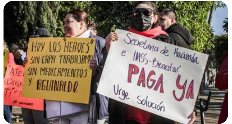
Trabajadores agremiados al Sindicato Nacional de Trabajadores de la Secretaría de Salud (SNTSA) en Baja California marcharon al Poder Ejecutivo Estatal en Mexicali como protesta por la falta de medicamentos e insumos médicos en los hospitales que son parte del IMSS-Bienestar.