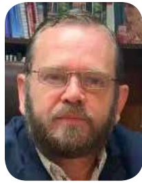
Nery Ruiz Arvizu

lo que costará en Sonora la elección judicial, que consistirá en 45 cargos entre jueces y magistrados del estado, misma que se llevará a cabo el 01 de junio próximo, informó el presidente del Instituto Estatal Electoral y de Participación Ciudadana (IEEyPC), Nery Ruiz Arvizu.