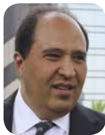
Cuauhtémoc Cárdenas Batel

Mantenerse al margen de las críticas al gobierno a veces da buenos resultados. Es el caso de la familia Cárdenas de México, donde el ingeniero Cuauhtémoc Cárdenas, hijo del general Lázaro Cárdenas del Río, se ha mantenido al margen y muy cuidadoso para criticar los errores evidentes del gobierno de la Cuarta Transformación.